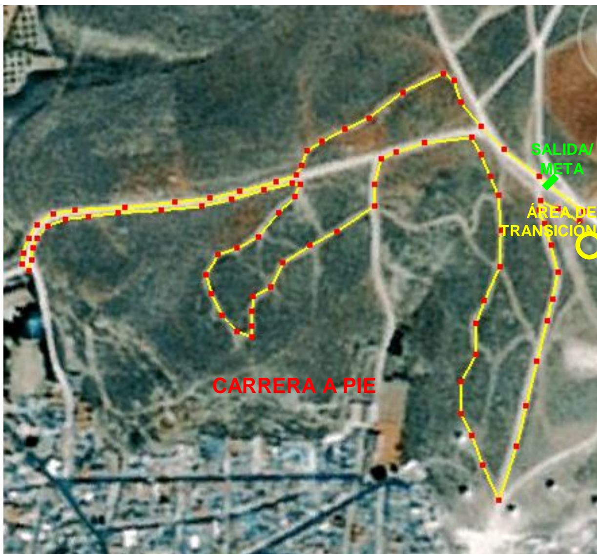
PERFIL CARRERA A PIE