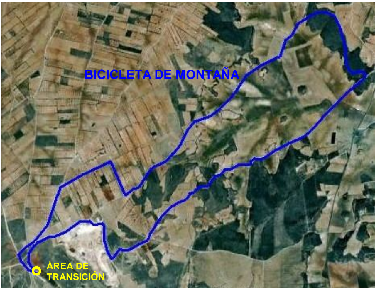
PERFIL BICICLETA DE MONTAÑA