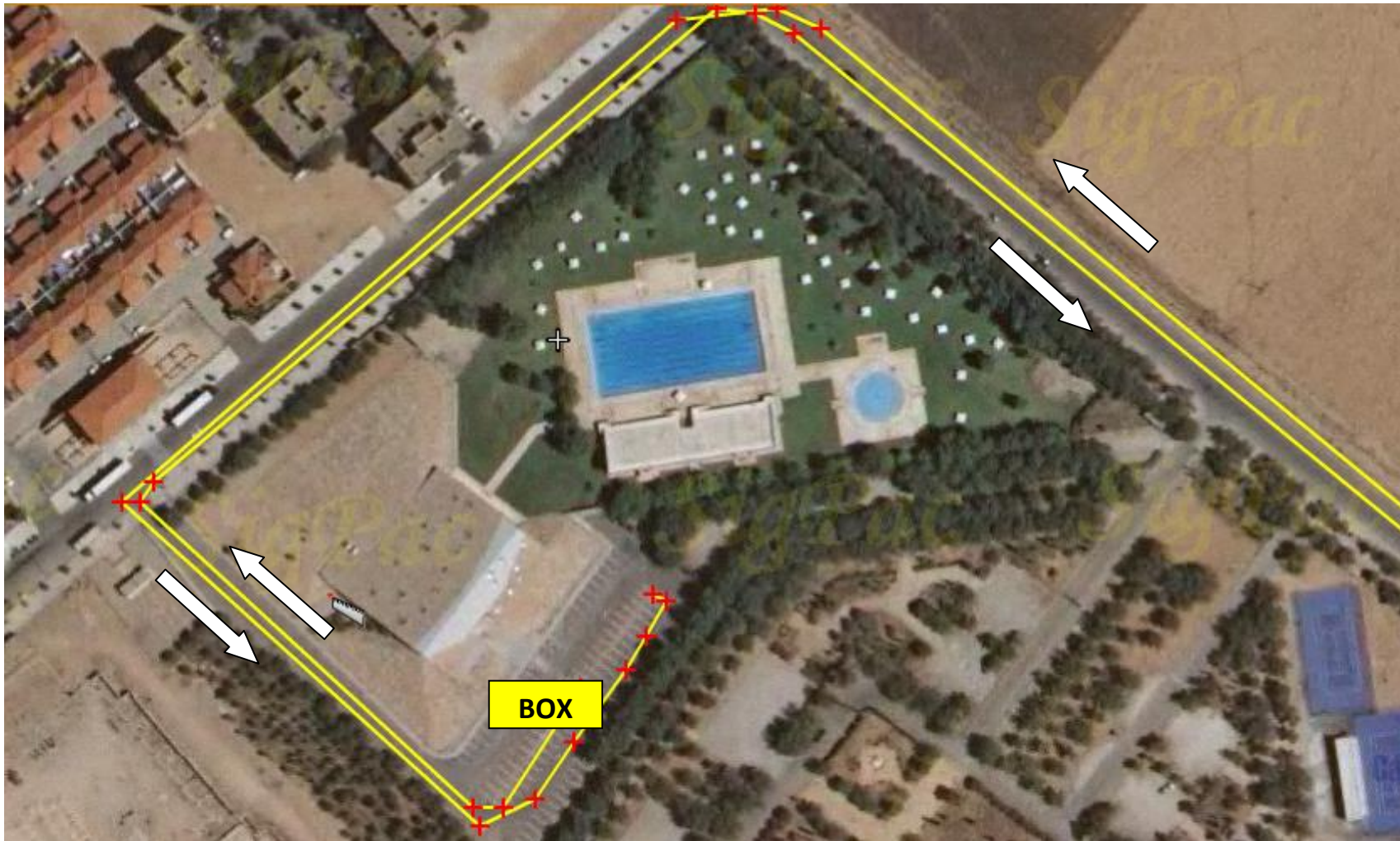
SECTOR CICLISMO: circuito 20 km.