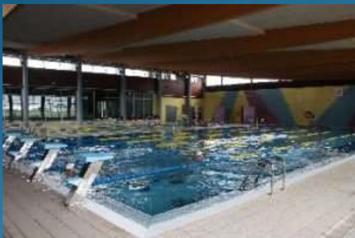
Piscina David Castro Fajardo